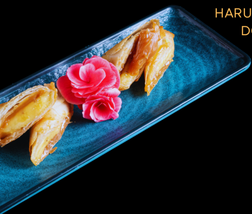
HARUMAKI BANANA COM DOCE DE LEITE

2 unidades: rolinho primavera recheado com doce de leite e banana