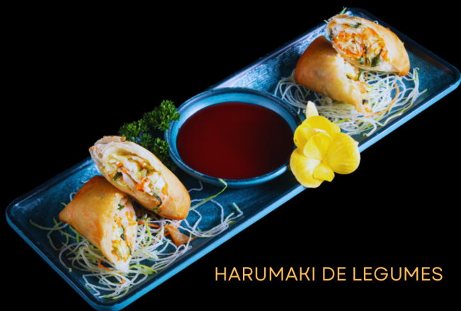
HARUMAKI DE LEGUMES