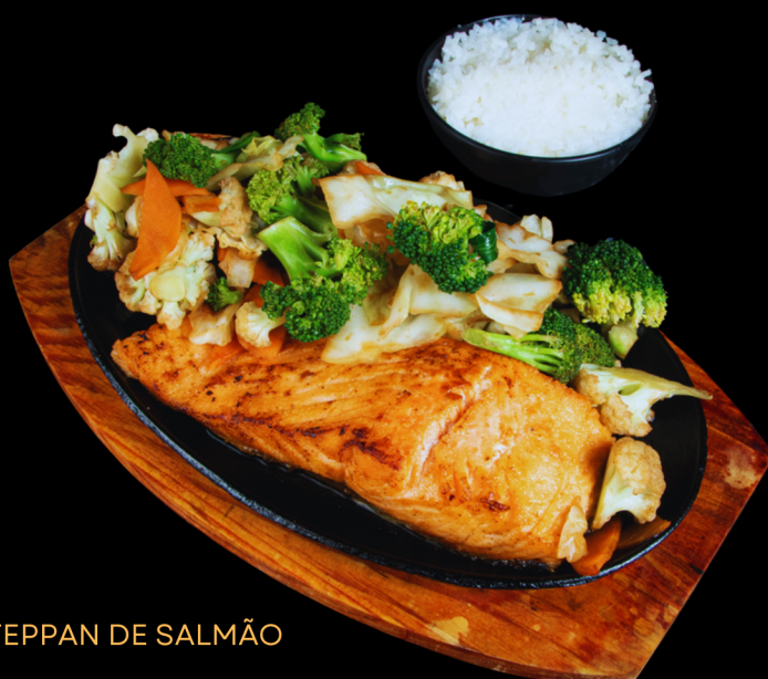
TEPPAN DE SALMÃO