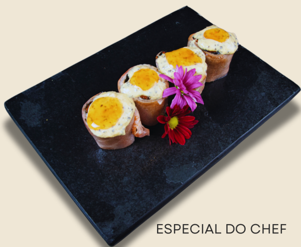
ESPECIAL DO CHEF

Tamanho médio: sushi enrolado à mão em formato de cone, recheado com arroz, salmão em cubos e cream cheese, empanado em farinha panko