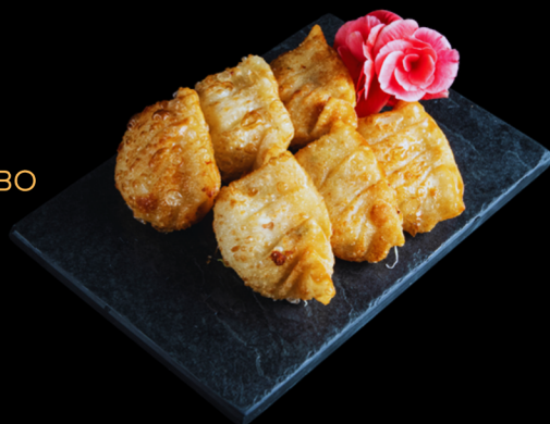
GYOZA DE LOMBO

6 unidades: pastéis japoneses fritos ou no vapor recheados com legumes