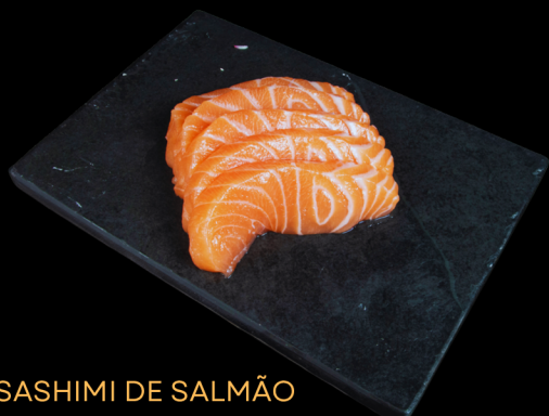
SASHIMI DE SALMÃO