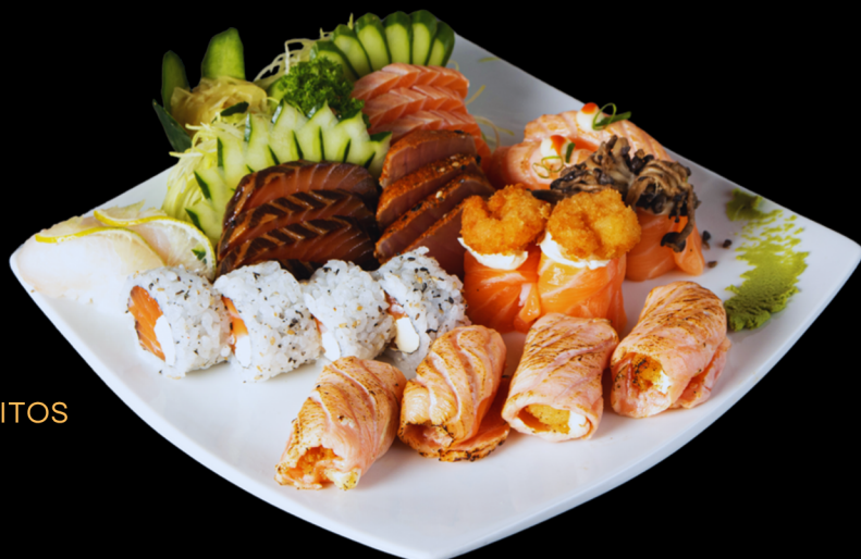
COMBINADO DOS FAVORITOS

80 unidades: 6 sashimi salmão, 6 sashimi atum, 6 sashimi tilápia, 6 sashimi polvo, 4 sashimi kani kama, 4 nigiri salmão, 4 nigiri atum, 4 nigiri tilápia, 4 nigiri polvo, 4 nigiri camarão, 4 nigiri kani kama, 4 uramaki califórnia, 4 uramaki filadélfia, 4 hossomaki tekka maki, 4 hossomaki shake maki, 4 hossomaki kappa maki, 4 nigiri jow e 4 nigiri sriracha