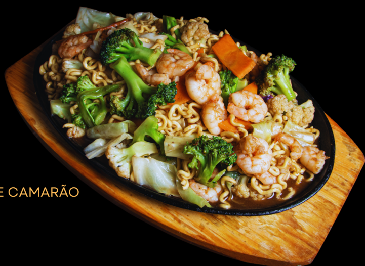
YAKISOBA DE CAMARÃO

Caldo da sua escolha, alga, ovo, kamaboco, moyashi, carne suína, macarrão, cebolinha, pimenta togarashi e sriracha