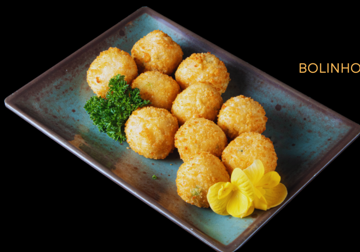
BOLINHO DE SALMÃO

10 unidades: bolinhos recheados com frango e cream cheese