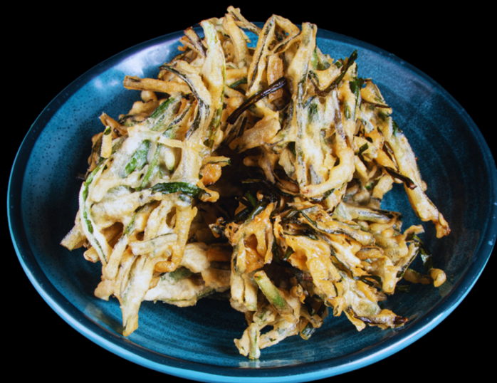
TEMPURÁ DE NIRÁ